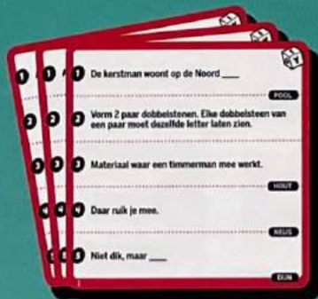
50 rode schrijfkarten (500 vragen)