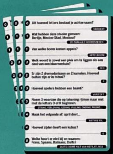
50 blauwgroene verbale kaarten (1.000 vragen)