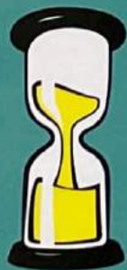
1 zandloper (30 seconden)